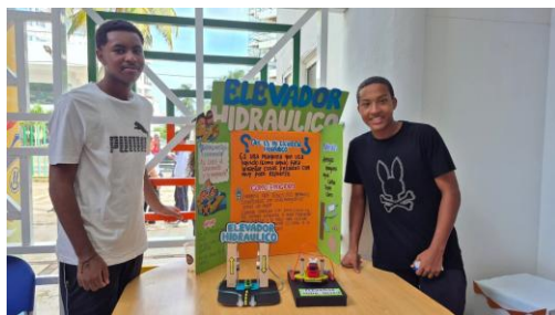
Información de la fotografía: Feria de la Ciencia