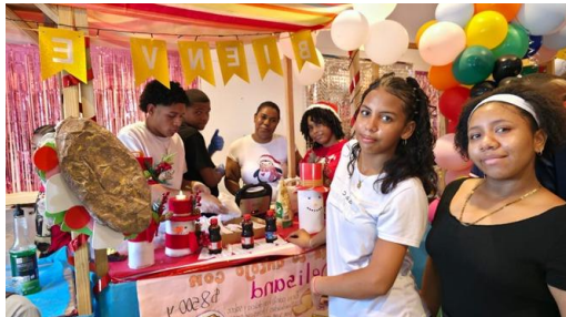
Información de la fotografía: Feria del emprendimiento