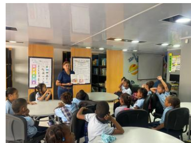
Información de la fotografía: Visita a la Biblioteca de Cajasai estudiantes de Bautista Central