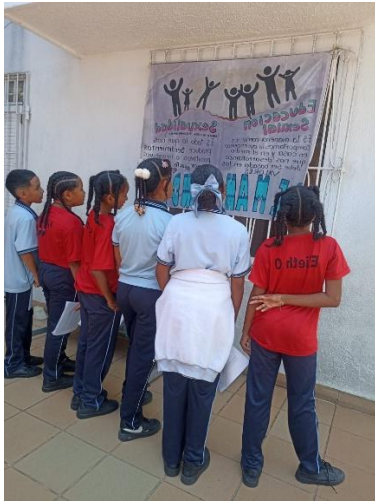
Información de la fotografía: Taller de sexualidad sede Bautista Central