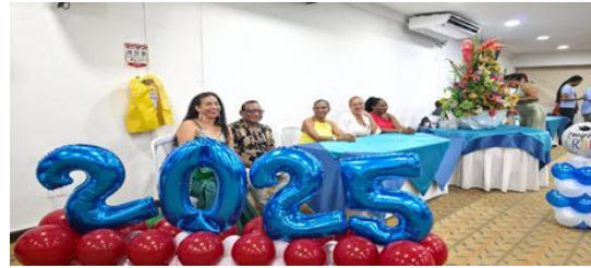
Información de la fotografía: ceremonia de graduación 2025