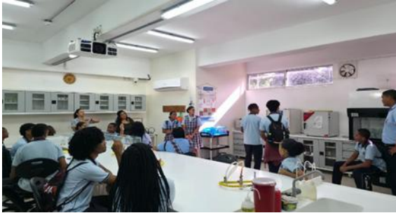
Información de la fotografía: Feria de la ciencia y emprendimiento