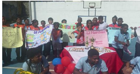
Información de la fotografía: fortalecimiento de valores y convivencia - participación copa claro