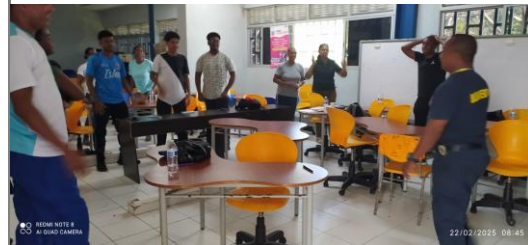
Información de la fotografía: Capacitación Gestión de riesgos